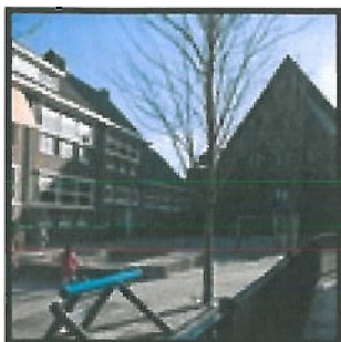
Locatie: Windroos, Bierstraat 45