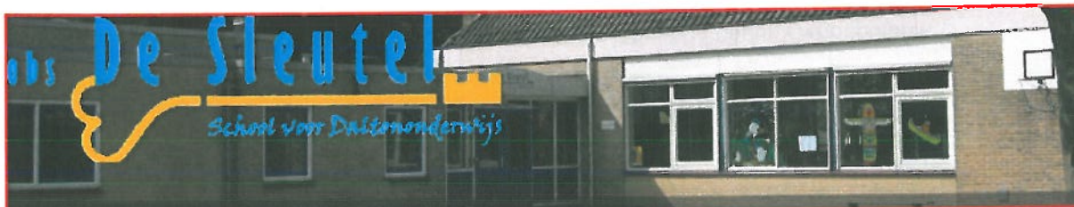
Locatie: De Sleutel, Schalkhaar

De Sleutel is een openbare basisschool, opgericht in 1969. De school volgt het Daltonconcept.