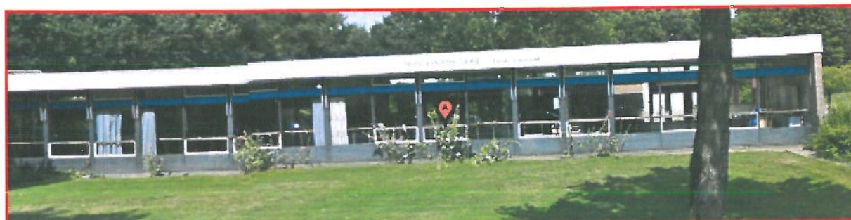
Locatie: Eerste Deventer Montessorischool, Groenewold 186-188

De Eerste Deventer Montessorischool, locatie Groenewold, is de 2 o dislocatie van de Montessorischolen in Deventer. Zij is nu nog gevestigd aan het Groenewold 186-188. De hoofdlocatie is het gebouw de Van Lithstraat in het voedingsgebied Keizerslanden.