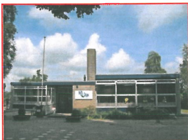
Locatie: Dol-Fijn (Okkenbroek)

Dol-Fijn is een school met 2 vestigingen. De hoofdvestiging staat in Deventer (voedingsgebied Colmschate-Zuid), de nevenvestiging in het dorp Okkenbroek, aan de Oerdijk 149. Hoewel beide vestigingen hun eigen karakter hebben, zijn de onderwijskundige uitgangspunten hetzelfde. De school presenteert zich dan ook nadrukkelijk als één school. Met ingang van het schooljaar 2010-2011 heeft deze vestiging ook een buitenschoolse opvang.