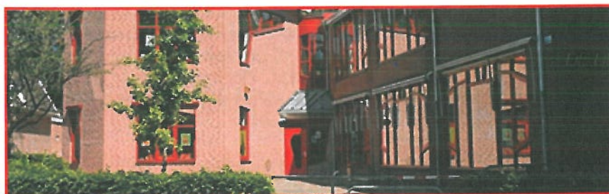
Locatie: De Dorpsschool Bathmen

Basisschool De Dorpsschool is een school voor openbaar primair onderwijs in Bathmen (Schoolstraat 11). De kinderen van de school komen veelal uit het dorp Bathmen en uit de directe omgeving.