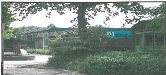
Een deel van het complex de Polakkers bij de Prins Mauritschool

De Prins Mauritschool is één van de vijf Christelijke Dalton basisscholen in Deventer. Er wordt onderwijs gegeven aan de hand van de Dalton-principes zelfstandigheid, samenwerking en vrijheid, gekoppeld aan verantwoordelijkheid.