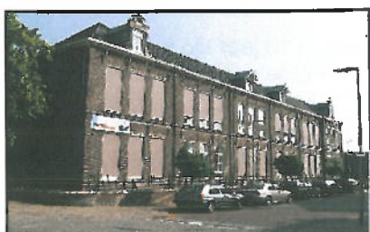
Locatie: Deventer Circuitschool, Enkdwarsstraat 2a

De Deventer Circuitschool in de Voorstad is erin geslaagd om de negatieve spiraal waarin de school zich bevond te doorbreken. Het aantal leerlingen stijgt licht en het aantal gewichtleerlingen neemt voorzichtig af. Dit ook een gevolg van het besluit in 2008 om het gebouw aan de Enkdwarsstraat te handhaven en te renoveren. De renovatie is inmiddels uitgevoerd en is er in 2009 een extra speelzaal gerealiseerd. In de beide gebouwen aan de Enkdwarsstraat zijn 19 lokalen aanwezig. Het aantal leerlingen van de school geeft slechts een ruimtebehoefte van 5 lokalen. Uit de prognose blijkt dat het aantal groepen aan de Enkdwarsstraat 5 of 6 bedraagt. De leegstand van de overige circa 13 lokalen wordt opgevuld met 4 lokalen ten behoeve van de Tintaan en 5 lokalen zijn permanent in gebruik bij de Brede school ten behoeve van Raster, Carinova en de bibliotheek. De dan resterende leegstand is in principe beschikbaar voor andere activiteiten (circa 4 lokalen).