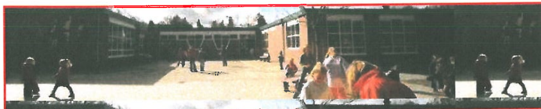
Locatie: Zonnewijzer (Diepenveen)

Basisschool "De Zonnewijzer" is een school met interconfessioneel onderwijs in Diepenveen. De kinderen van de school wonen in Diepenveen of omgeving. De school is gehuisvest in een eigentijds gebouw aan de rand van Diepenveen.