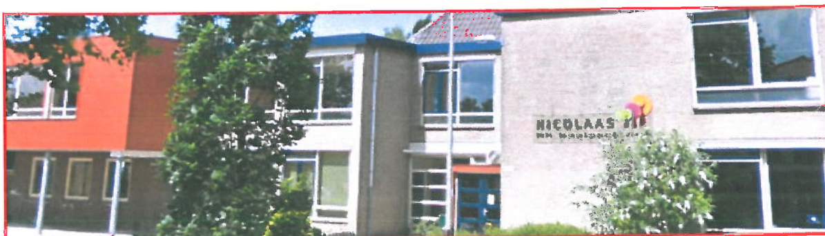
Locatie: Nicolaasschool, Schalkhaar

De Nicolaasschool is een Rooms Katholieke school in het dorp Schalkhaar, gevestigd aan de Pastoorsdijk 9. Per 1 oktober 2010 telde de school 375 leerlingen, verdeeld over 16 groepen.