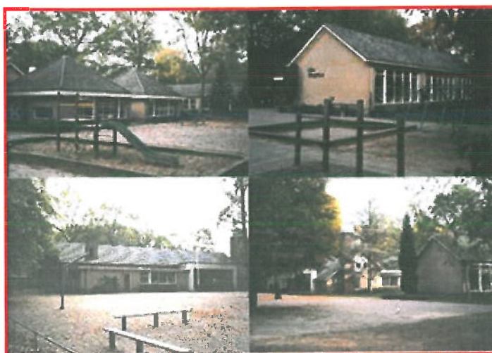
Locatie: OBS Slingerbos, Diepenveen

Basisschool 'Slingerbos' is de school voor openbaar primair onderwijs in Diepenveen. De kinderen van de school komen uit het dorp Diepenveen en uit de directe omgeving. De school heeft 3 schoolpleinen en 6 ingangen, zodat het gevoel van kleinschaligheid niet verloren gaat. In 2004 is het gebouw uitgebreid met vier nieuwe lokalen, een nieuwe gymzaal en extra ruimtes voor vele activiteiten.