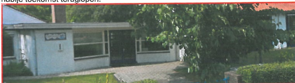
Locatie: eerste Deventer Montessorischool, Van Lithstraat 1

De Montessorischool is een stedelijke voorziening. Gezien over de 3 locaties van de Montessorischolen in Deventer is een geleidelijke terugloop in leerlingenaantal te constateren. Met name is dit te merken in het leerlingenaantal van de locatie Groenewold. Vanaf 2010 staan er 2 lokalen leeg en op de lange termijn zijn dit 3 lokalen. Bij stedelijke voorzieningen wordt eerst de hoofdlocatie volledig benut en daarna de 1 o dislocatie. Leegstand ontstaat dan ook alleen in de 2 o dislocatie. De hoofdlocatie aan de Van Lithstraat en de 1 o dislocatie zijn adequaat gehuisvest. De ruimtebehoefte van de 2 o dislocatie (straks in Kei13) zal dus ook in de nabije toekomst teruglopen.