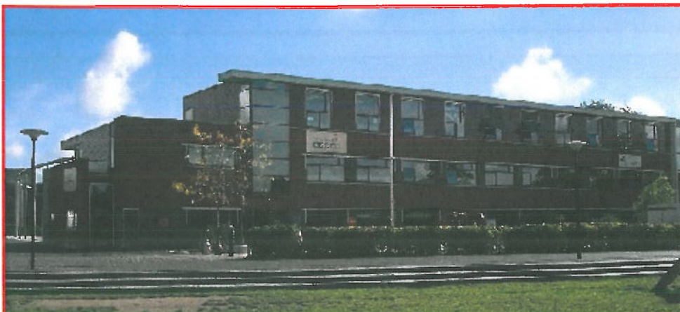
Een gedeelte van het pand Andriessenplein vanuit het park gezien.

De Vijf-er is de Katholieke basisschool in de Vijfhoek. Ook deze school kende een grote groei in de afgelopen jaren. Op 1 oktober 2010 zijn er 541 leerlingen met een gezamenlijke ruimtebehoefte van 23 groepen. De school heeft per die datum nog 16 lokalen in het gebouw aan het Andriessenplein en de overige 7 groepen volgen onderwijs in de noodlokalen die zijn geplaatst aan de Willem Witsenstraat in de Spijkvoorderenk.