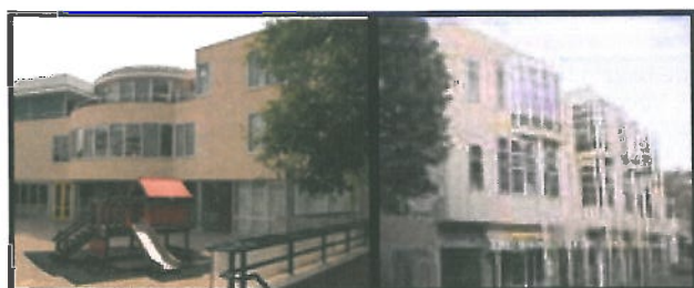
Locatie: Windroos (Deventer Binnenstad)

Basisschool de Windroos is in een modern schoolgebouw midden in de binnenstad van Deventer gevestigd (Broederenstraat 16). In dit multifunctionele gebouw, heeft de school de eerste en tweede verdieping in gebruik. Op de begane grond zitten winkels. Het schoolplein is op het binnenterrein en bevindt zich op het dak van de winkels. De Windroos heeft een dislocatie van 7 lokalen aan de Bierstraat 54. De dislocatie komt aan de orde bij het voedingsgebied Voorstad.