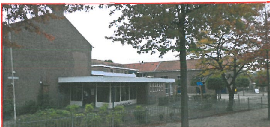
Locatie: Sint Lebuïnusschool, Spijkerpad 1