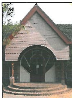
Locatie: Vrije School De Kleine Johannes, Oosterstraat 3A.