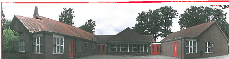
Locatie: Santa Maria (Lettele)

De rooms-katholieke school is gelegen aan de Bathmenseweg 39 in Lettele en is gebouwd in 1938. Naderhand is de school diverse malen uitgebreid. Eind jaren '90 is de school grondig gerenoveerd en aangepast aan de eisen van de tijd.