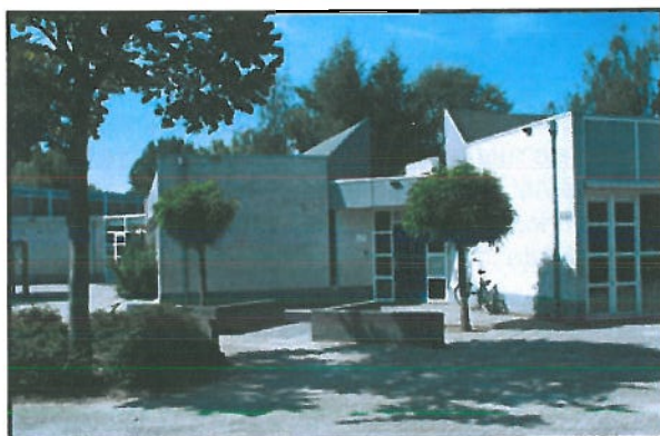
Locatie: L'Ambiente Eekhoorn, Eekhoorn 10.

De Montessorischool l'Ambiente heeft de hoofdvesting in dit voedingsgebied. Een schoolgebouw met 9 lokalen aan het Eekhoorn. Deze school is een stedelijke voorziening. Dat houdt voor de huisvestingcapaciteit in dat eerst de hoofdvesting wordt gevuld met leerlingen en dat daarna lokalen worden toegewezen in de dislocatie aan het Andriessenplein in de Vijfhoek. Het totaal aantal groepen van l'Ambiente is op 1 oktober 2010 vastgesteld op 19 groepen. De hoofdvesting aan het Eekhoorn wordt dus volledig gebruikt. Op dit moment is de L'Ambiente adequaat gehuisvest.