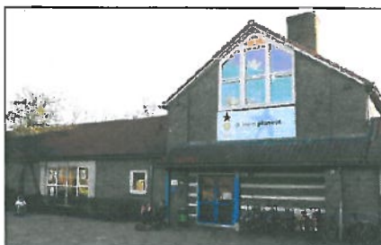
Locatie: Snippeling, De Kleine Planeet, Rielerweg 174

Het aantal kinderen op de vestigingen van de Snippeling is in 10 jaar tijd teruggelopen met circa 150 leerlingen. De dislocatie Kleine Planeet heeft echter de afgelopen jaren een stabiel leerlingenaantal. Desondanks ligt de behoefte van 4 tot 5 lokalen t/m 2015 onder de capaciteit van de 6 beschikbare lokalen in het gebouw. Formeel is er dus een geringe leegstand. Om de Kleine Planeet als aparte locatie te handhaven is een bewuste keuze van het schoolbestuur. De Kleine Planeet is dan ook adequaat gehuisvest.