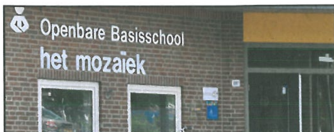
Locatie: OBS het Mozaïek, Smyrnastraat 1B

De prognosecijfers 2011 zijn hoger dan het feitelijke aantal leerlingen op 1 oktober 2010. Dit komt omdat een flink aantal leerlingen uit de Voorstad naar de Hagenpoortschool in de Binnenstad gaat. Daardoor zijn de komende 9 beschikbare lokalen niet allemaal nodig voor het basisonderwijs, maar worden gebruikt voor de Brede school. Het Mozaïek is adequaat gehuisvest.