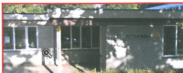
Locatie: De Rythmeen, Bathmen

De kinderen van de school komen veelal uit het dorp Bathmen en uit de directe omgeving, waarvan een groot deel uit Lettele en Okkenbroek.