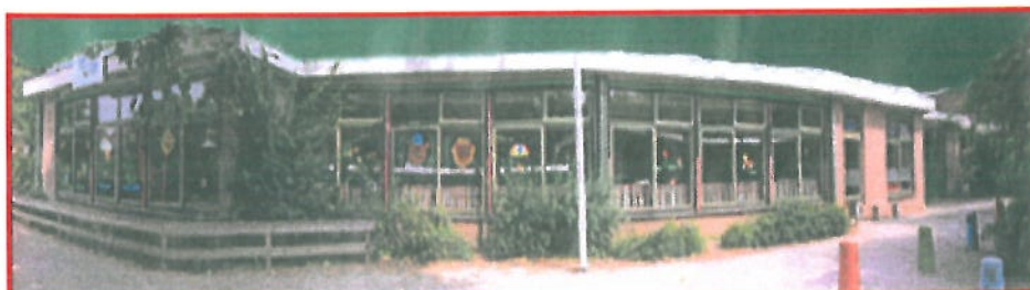
Een deel van het scholencomplex bij de basisschool het Roessink.

Het Roessink is een openbare school voor Daltononderwijs en maakt onderdeel uit van het gecombineerde scholencomplex en is gevestigd aan de Fonteinkruid 130.