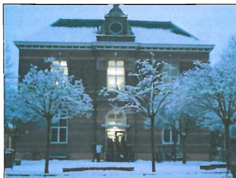
Locatie: Deventer Leerschool (Deventer Binnenstad)

De Deventer Leerschool is een school voor bijzonder neutraal onderwijs, gevestigd in een karakteristiek schoolgebouw uit 1891 in het hart van Deventer (Brinkpoortstraat 7). Op 1 oktober 2010 telde de school 228 leerlingen verdeeld over 10 groepen.