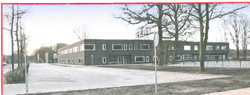
Locatie: De Flint en De Steenuil, Wezenland 582 (Kei13)

De Steenuil (voorheen De Horizon) is een Interconfessionele Daltonschool, eveneens gevestigd in het gebouw van de Kei13. Kei13 is een centrum voor de jeugd tot 13 jaar, opgezet naar Zweeds model. Centraal staat de huisvesting van twee scholen. Daarnaast is er ruimte voor naschoolse opvang, een peuterspeelzaal en een consultatie bureau. Een sportruimte en creatieve activiteiten complementeren het geheel. Kei13 was eind 2010 gereed en is begin 2011 in gebruik genomen.