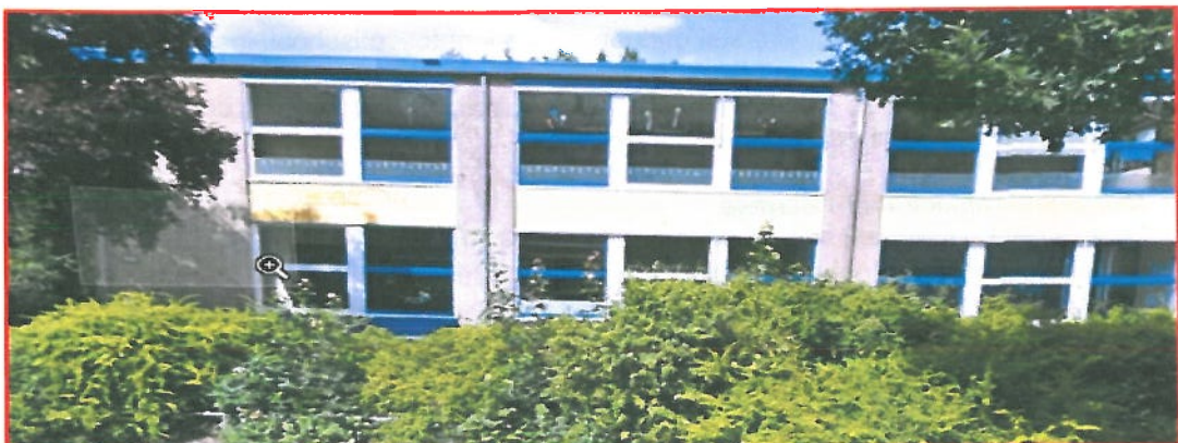
Locatie: De Zonnebloem, Wittenstein 128

Op 1 augustus 2011 gaat in de gemeente Deventer een nieuwe basisschool op islamitische grondslag van start. De school valt onder het bestuur van de Stichting Primair Onderwijs op Islamitische grondslag in Midden- en Oost Nederland (SIMON). De nieuwe school wordt voorlopig gehuisvest in het voormalige schoolgebouw van Horizon aan de Wittenstein 128 in de wijk Borgele te Deventer.