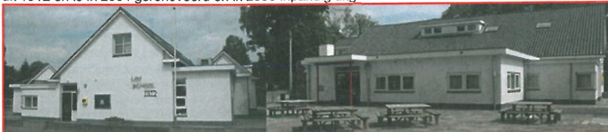
Locatie: Looschool, Loo

De Looschool is een school voor openbaar primair onderwijs en ligt in de kern Loo tussen de dorpen Bathmen, Harfsen, Laren en Holten. De school is gehuisvest in een gebouw uit 1912 en is in 2004 gerenoveerd en in 2008 in pandig uitgebreid.