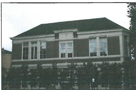
Locatie: Hagenpoortschool (Deventer binnenstad)

De school is gehuisvest in een monumentaal pand uit 1894 in de Bagijnenpoort 13. De school ligt naast het Burgerweeshuis en heeft een schoolplein aan de overkant van de straat. De school bestaat uit acht lokalen en een speelzaal. Het pand is in 2005 verbouwd, waarbij met name de lokalen op de begane grond zijn aangepast. De Hagenpoort is sinds 2003 een Daltonschool met extra aandacht voor kunst en cultuur.