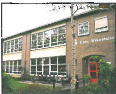
Locatie: Cees Wilkeshuisschool (Zwolse wijk)