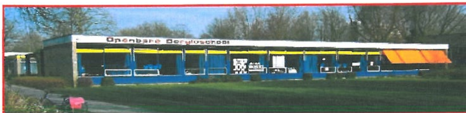
Locatie: Borgloschool, Groenewold 182

De Borgloschool is een openbare school gelegen in de wijk Borgele aan het Groenewold 182.