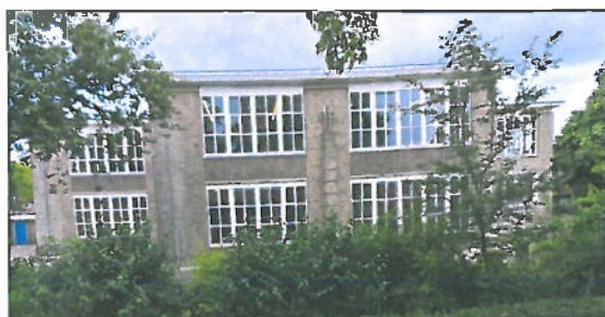
Locatie: Montessorischool, Oudeanstraat (Zwelse Wijk)