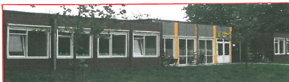
Locatie: de Olijfboom, Kon. Wilhelminalaan 16

Op 1 augustus 2011 gaat in de gemeente Deventer een nieuwe basisschool op evangelische grondslag van start, genaamd 'de Olijfboom'. De nieuwe school wordt voorlopig –voor de eerste 5 jaar- gehuisvest in het voormalige schoolgebouw van Horizon aan de Koningin Wilhelminalaan 16 in de wijk Keizerslanden te Deventer. Per 1 oktober 2011 wordt gestart met 81 leerlingen en de groepen 1 t/m 6.