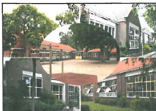
Locatie: Adwaita, lokatie J.van Deventerstraat (Zwolse wijk)

De Adwaita is een rooms-katholieke basisschool met twee vestigingen in de Zwolse wijk. De hoofdlocatie zit op de J. Van Deventerstraat 10 en de dislocatie op de Kerkstraat 3. Bij de samenvoeging van beide scholen is de nieuwe naam Adwaita gekozen, wat in het Sanskriet betekent 'hij die de tweeheid overwint'. Op de Adwaitaschool wordt adaptief onderwijs gegeven. Op 1 oktober 2010 telde de school 357 leerlingen verdeeld over 18 groepen.